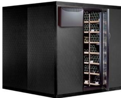
Cabina Clima 2040 Capacità Bottiglie: 2040