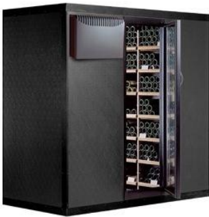
Cabina Clima 990 Capacità Bottiglie: 990