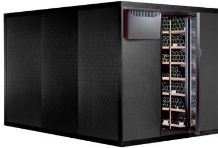
Cabina Clima 3090 Capacità Bottiglie: 3090