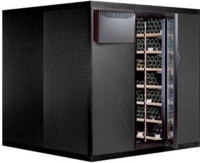
Cabina Clima 2040 Capacità Bottiglie: 2040