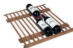
Ripiano in legno a grande carico: fino a 52 bott.