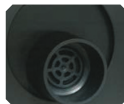
FILTRO A CARBONE: Dispositivo interno a carboni attivi che elimina i cattivi odori.

i LED di serie: superiore e laterali Full-Glass per vino